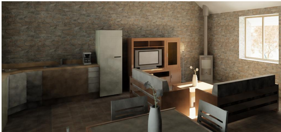
VISTA VIRTUAL DEL SALON-COMEDOR-COCINA